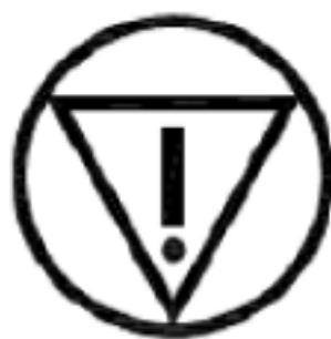
图 1 紧急制动的符号(5638)

当需要使用符号来说明时，应使用 IEC 60417(DB:2002-10)中的符号 5638(见图 1)。