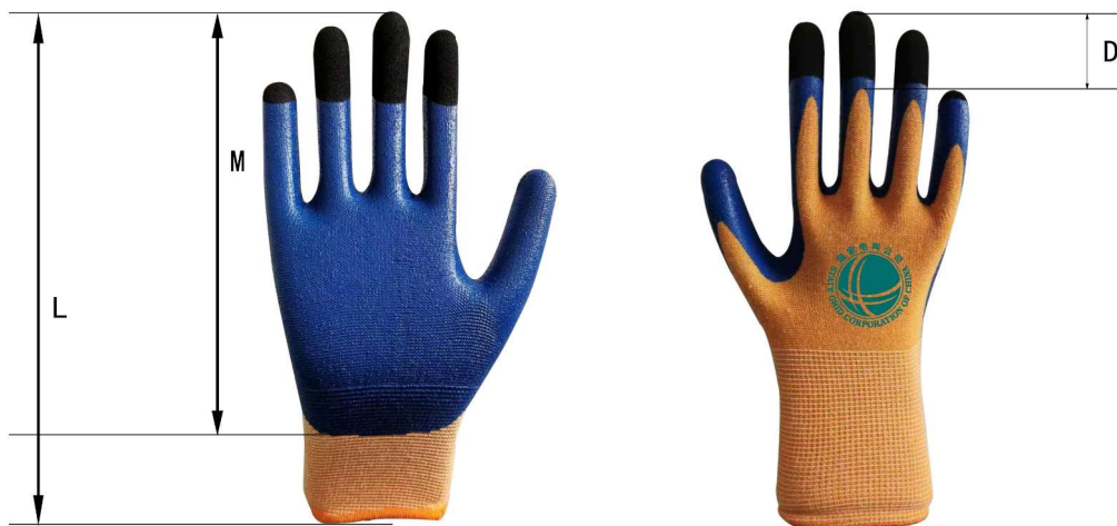
图 1 计量作业手套示意图